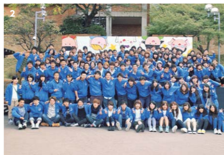
1 2015年度橋祭の様子。大学祭実行委員会は幅広く、友達がいっぱいできる場所。楽しく交流を持てるイベントを企画しました。人に楽しんでもらうことで、自分が楽しくなります。 2 2015年度橋祭のとき、大学祭実行委員会のメンバーで。