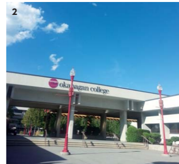
1 TOEIC勉強会の様子 2 留学先のオカナガン大学 私はカナダのオカナガン大学へ留学しました。英語の勉強だけではなく、さまざまな交流のなかで、海外の文化に触れることができ、大変貴重な経験となりました。