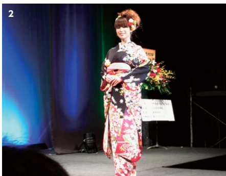
1 写真はイベントに向け、和洋菓子研究会のメンバーとラングドシャとシューレンをつくっています。七夕陶灯路や大学祭に出店したり、地域のイベントに参加しています。みんな仲がよく、和気あいあいと活動しています。 2 石川で開催されたNPO法人主催のきものコレクションショーに出演！貴重な経験をさせていただきました。